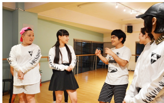
フラッシュモブ「まゆ毛太い」動画撮影の様子